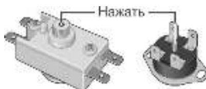
Рисунок 3. Возможные схемы расположения кнопки термовыключателя

Вышеперечисленные неисправности не являются дефектами ЭВН и устраняются потребителем самостоятельно или за его счет.